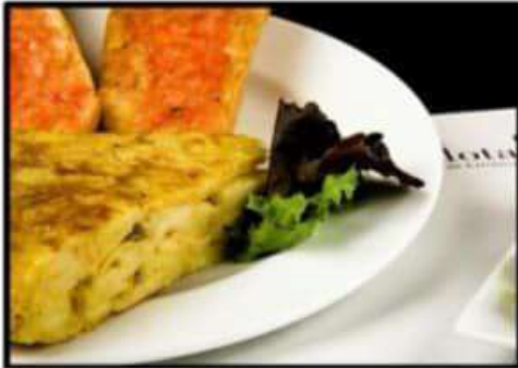
Tortilla de patatas y cebolla ..... 4.20€ Potato and onion omelette