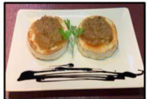
Queso de cabra con cebolla..... 6.50€ caramelizada y reducción de balsamico