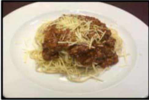
Espaguetis a la bolognesa..... 11.75€