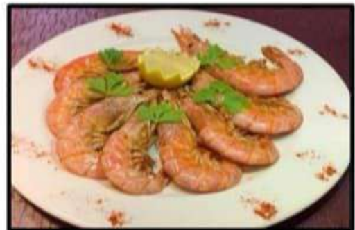
Gambas Langostineras..... 11.90€ a la plancha con ajo y perejil Shrimp scampi with garlic and parsley