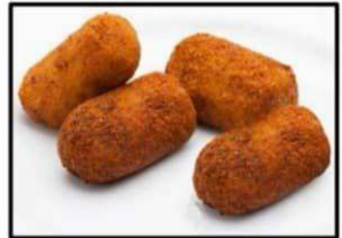
Croquetas de jamón ..... 5.95€ de Bellota (4 uds) Bellota ham Croquettes