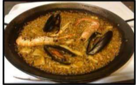
Paella Marinera ..... 17.50€ Seafood paella