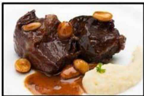
Carrillera ibérica estofada.... 15.50€