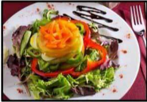
Cojodongo..... 10.90€ (Tomate, pepino, pimiento, cebolla y vinagreta) (Tomato, cucumber, pepper, onion and vinaigrette)