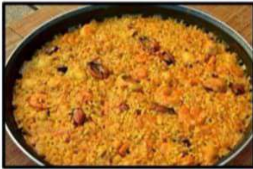
Paella Parellada..... 16.95€ Seafood bounded and shelled