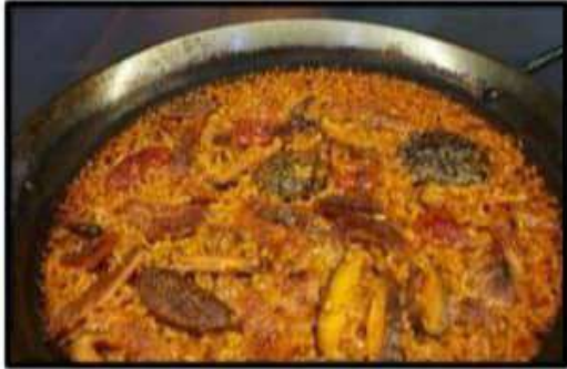
Paella secreta iberico ..... 16.25€ Iberian secret paella