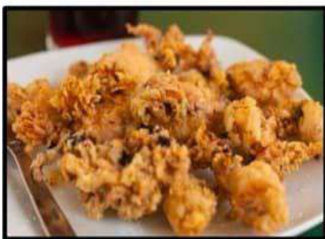
Chipirones fritos..... 8.10€ Fried baby squids