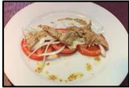
Ensalada de ..... 12.50€ Ventresca de atún, cebolla tierna y tomate Tuna belly, onion and tomato