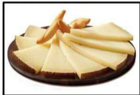
Surtido de Quesos..... 16.20€ Assortment of cheeses