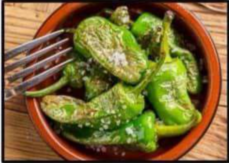
Pimientos de padrón ..... 4.20€ Fried padrón green peppers