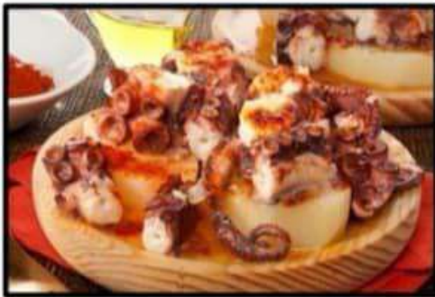
Pulpo a la gallega..... 15.50€