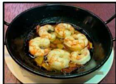
Gambas al ajillo..... 10.95€ Garlic prawns