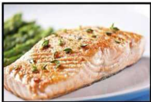
Salmon a la plancha ..... 13.50€