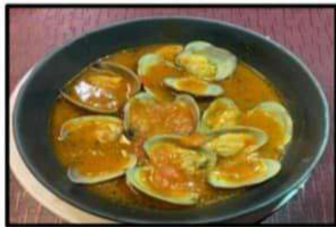
Almejas a la marinera..... 14.75€