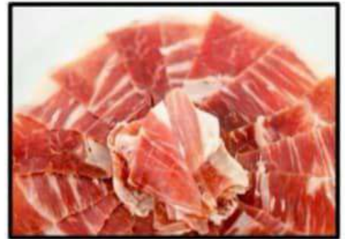
Jamón de bellota ..... 13.50€ D.O Dehesa de Extremadura Bellota ham D.O Dehesa de Extremadura