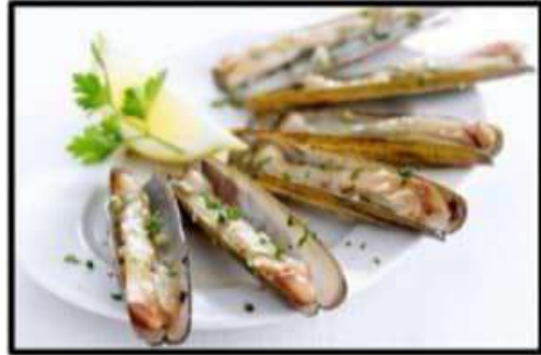
Navajas a la plancha..... 14.50€