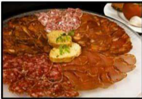
Surtido de Ibericos..... 16.10€ Iberian assortment