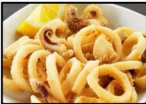
Calamares andaluza..... 11.95€ Andaluzian squids