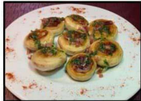
Champiñones..... 6.90€ a la plancha con virutas de jamón Mushrooms with shavings of ham