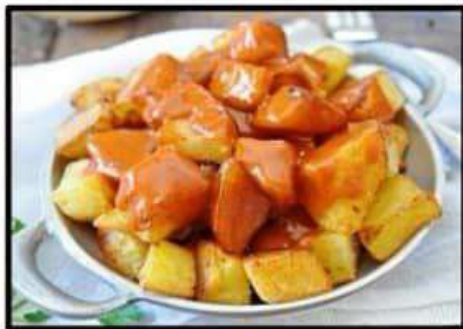
Patatas bravas ..... 4.60€ Spicy potatoes