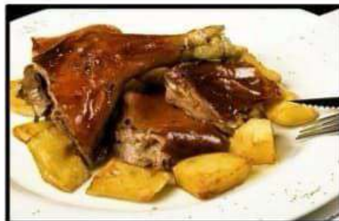
Cochinillo ibérico..... 20.30€