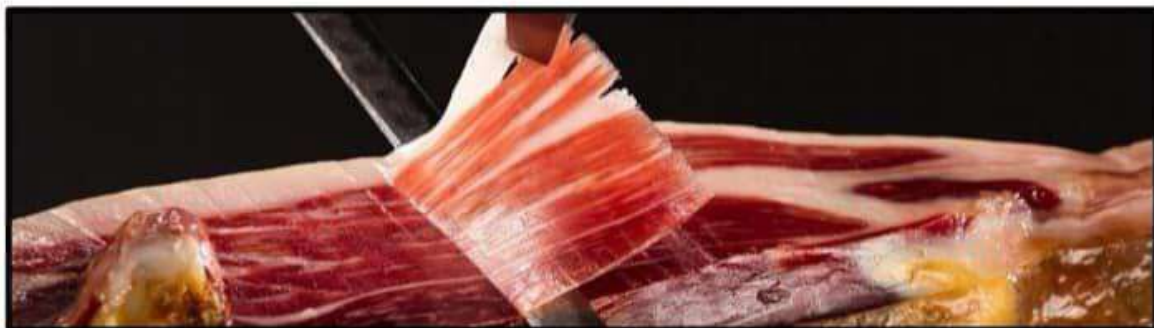
Jamon de Bellota de Dehesa de Extremadura ..... 22.50€