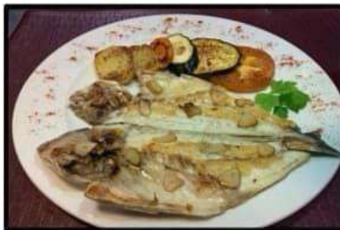
Dorada donostiarra..... 14.50€