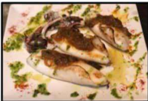
Calamares a la placha..... 15.50€