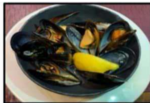
Mejillon al vapor..... 7.75€