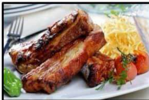
Costillas de cerdo adobadas... 14.75€

Stewed Iberian cheek with potato parmentier