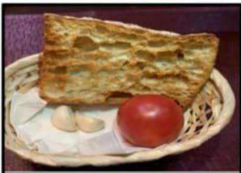
Pan de cristal con tomate y ajo..... 2.25€ Cristal bread with tomato and garlic