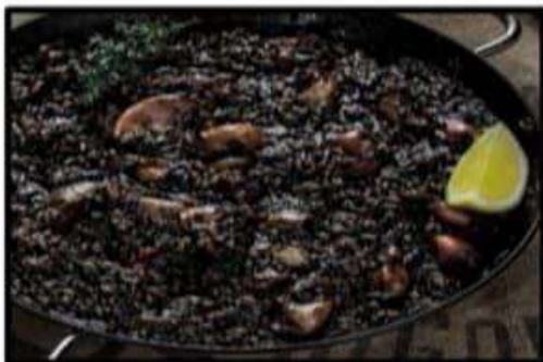
Arroz Negro con alioli..... 16.95€ Black rice with allioli