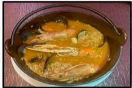
Arroz Caldoso..... 18.50€ Soupy rice with seafood