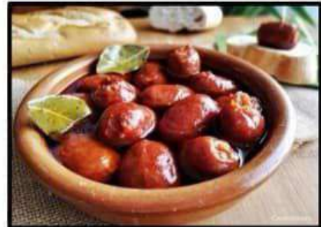
Choricitos al vino..... 5.20€ Sausages to wine